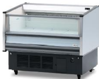
冷凍オープンケース