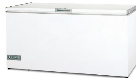
冷凍チェストフリーザー