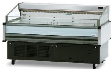
冷蔵オープンケース

※上記以外の備品をご希望の場合は事務局までお問い合わせください。別途お見積りさせていただきます。