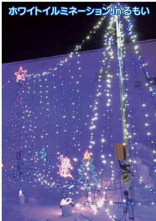
ホワイトイルミネーションinるもい