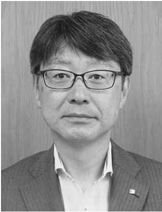
北海道留萌振興局長