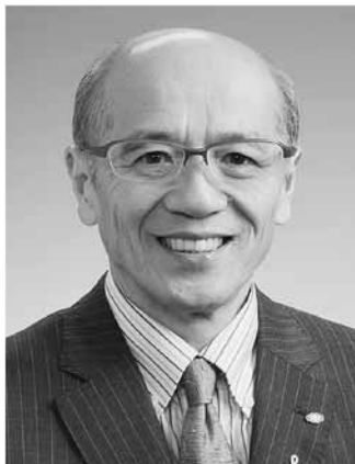
留萌市長 高 橋 定 敏