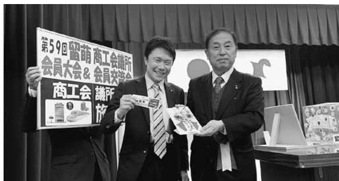
〈会員交流会での抽選会〉