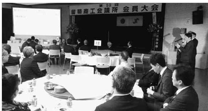
〈各部会・委員会、青年部による活動報告〉

便利で使いやすい産業会館をご利用ください。 ※冷暖房完備 ■ 申込、お問い合わせは留萌商工会議所業務課へ ☎ 四二二〇五八