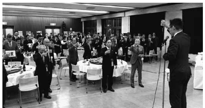
〈浅野道議による乾杯〉