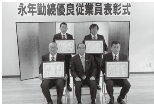
※撮影の為、特別にマスクを外しております