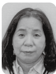
井原水産㈱土佐奈美枝