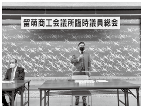
就任挨拶をする大石会頭